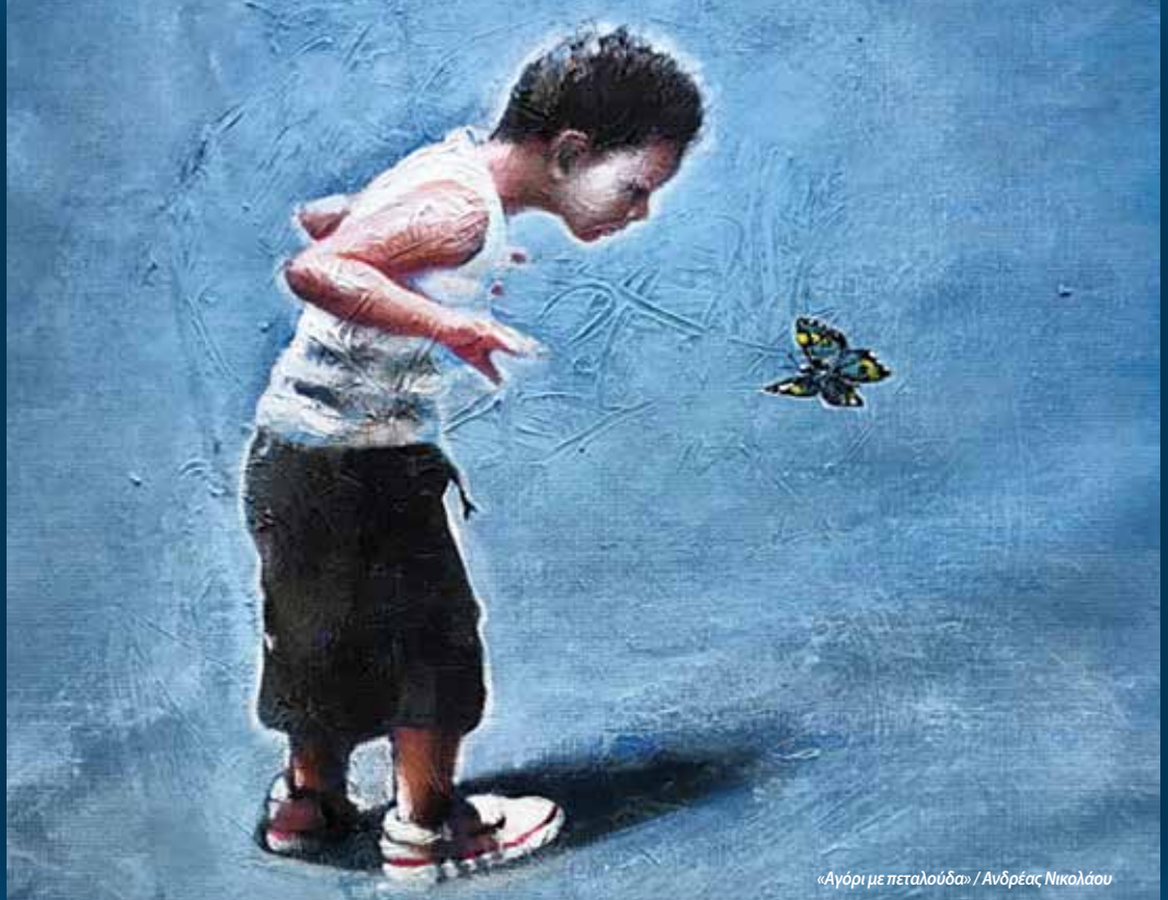
«Αγόρι με πεταλούδα» / Ανδρέας Νικολάου